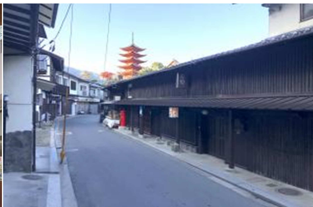
宮島町重要伝統的建造物群保存地区

世界遺産宮島への玄関口として整備が進む宮島口、伝統的まちなみを残す建造物群保存地区、改修工事の終わった大鳥居など、宮島まち歩きへのお誘いです。